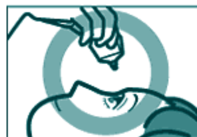
容器の先を下に向けて点眼