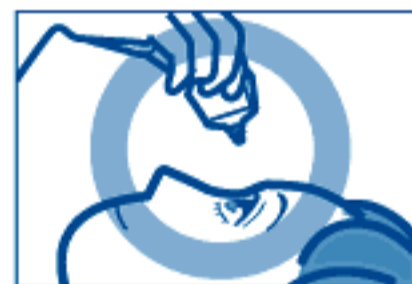
容器の先を下に向けて点眼