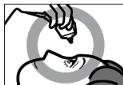
容器の先を下に向けて点眼