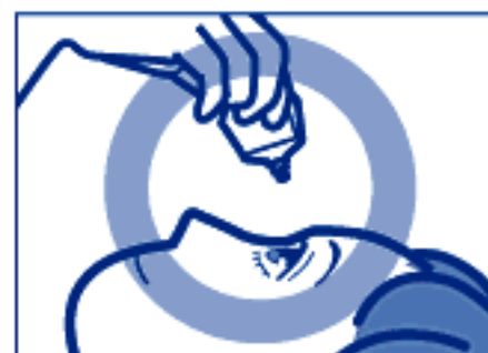
容器の先を下に向けて点眼