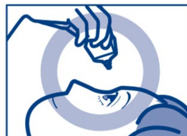
容器の先を下に向けて点眼