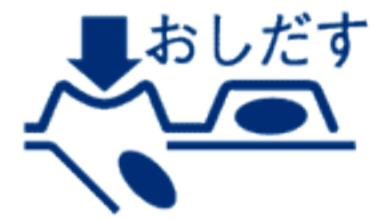
(PTPシートの取り出し図)

右図のように錠剤の入っているPTPシートの凸部を指先で強く押し裏面のアルミ箔を破り、取り出してお飲みください。(誤ってそのまま飲み込んだりすると食道粘膜に突き刺さるなど思わぬ事故につながります。)