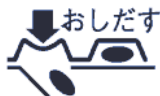
(PTPシートの取り出し図)