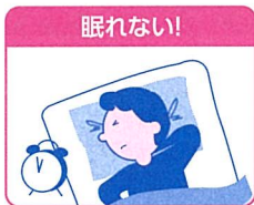
体が暖まるとかゆい!