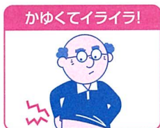
老人のカサつく肌に