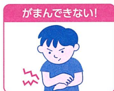
小児のカサつく肌に