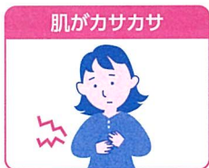
成人のカサつく肌に