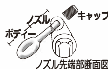
ノズル先端部断面図

キャップをはずし、清潔な指に患部をおおう量の軟膏を取り、そのまま塗布するか、またはガーゼなどにのぼして患部に貼付してください。