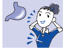
3 直接・効果的に作用します