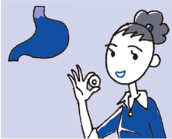
1 かみくだくと有効成分が じわじわと食道を通して