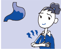
2 胸やけの原因となる胃の 上部の荒れた胃粘膜に