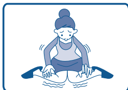
背中や脚など広い範囲のかゆみ・皮膚炎