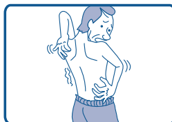
お風呂上がりやねるときに